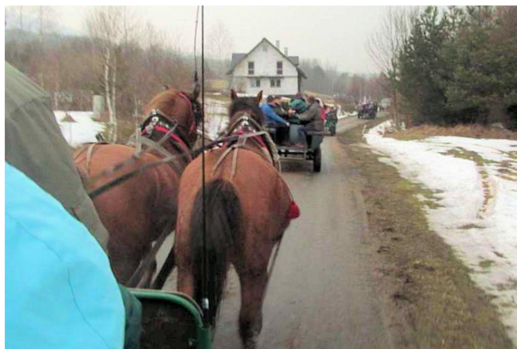
Przejazd bryczkami po krainie Beskidu Niskiego