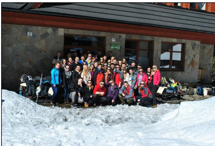
Uczestnicy XI Ogólnopolskiego Rajdu Studentów Geodezji