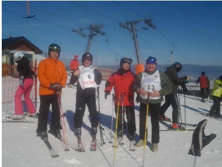
Uczestnicy XXVI OMNG