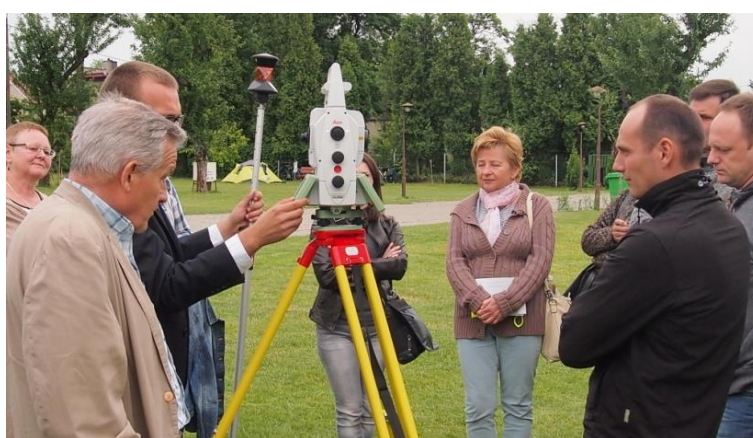
„Geopraktyki Tarnów 2015” praktyczne warsztaty