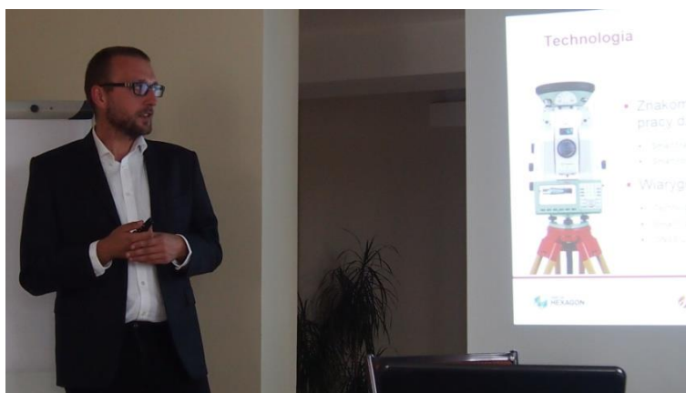
Przedstawiciel firmy NADOWSKI prowadzi „Geopraktyki Tarnów 2015”

w firmie, korzystanie ze stacji referencyjnych NADOWSKI NET oraz skaning laserowy połączone z zajęciami praktycznymi w terenie.