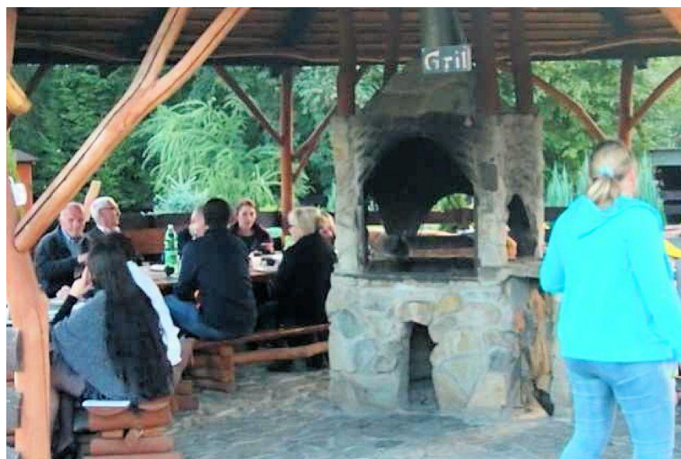
Wspólna biesiada „Pod Gruszą”