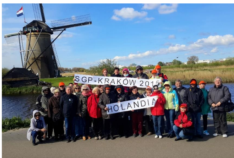
Uczestnicy 26 wyprawy w Kinderdijk