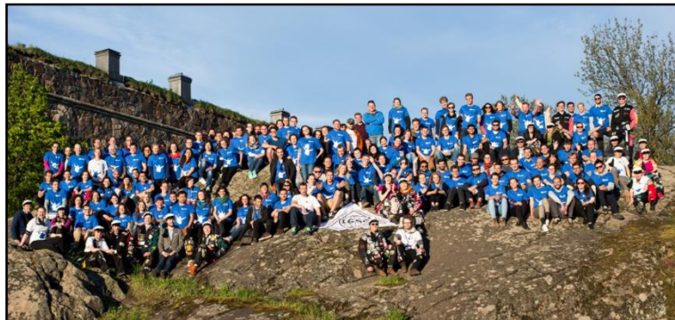
Uczestnicy XXVIII Międzynarodowej Konferencji Studentów Geodezji w Espoo w Finlandii.