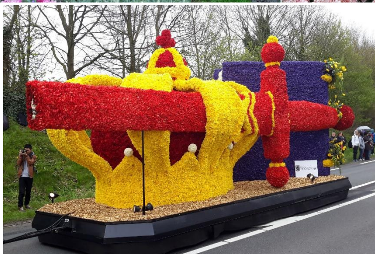
68 Parada Kwiatów w Keukenhof