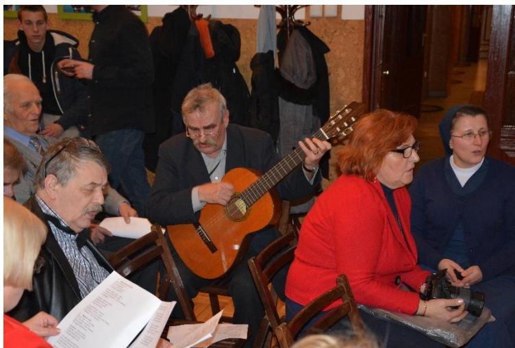
Wspólne kolędowanie SGP Oddział Kraków

W roku 2014 prowadziliśmy działalność stowarzyszeniową organizując szkolenia, kursy, wycieczki i inne imprezy o charakterze towarzysko-integracyjnym: