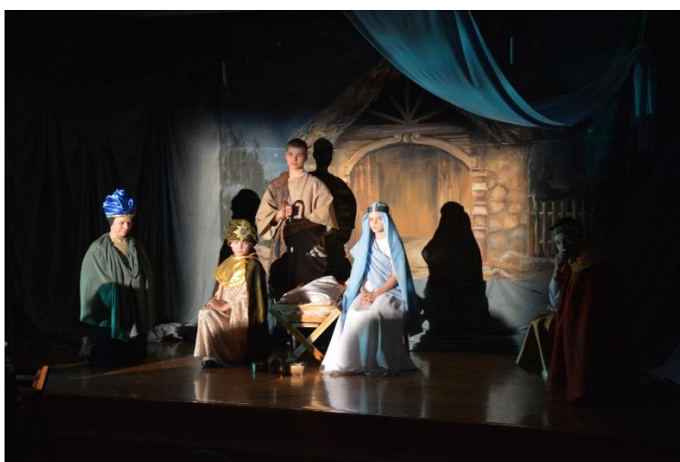
Jasełka w wykonaniu podopiecznych Domu św. Ludwika w Krakowie