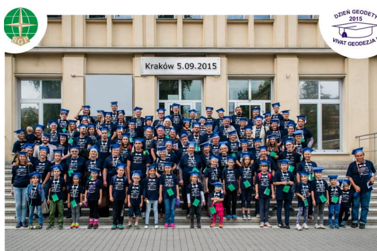
Dzień Geodety 2015, uczestnicy obchodów na schodach Szkoły Głównej Pomiarowej