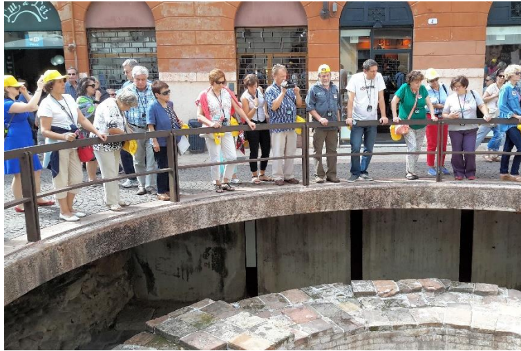
Uczestnicy 27 wyprawy