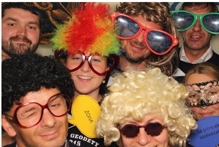
Juwenalia podczas Dnia Geodety 2015