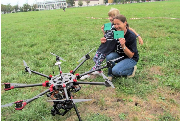
Zajęcia terenowe z Dronologii i Nowoczesnych Technik Pomiarowych na Błoniach Krakowskich