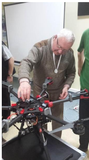
Szkolenie XXVI OMNG