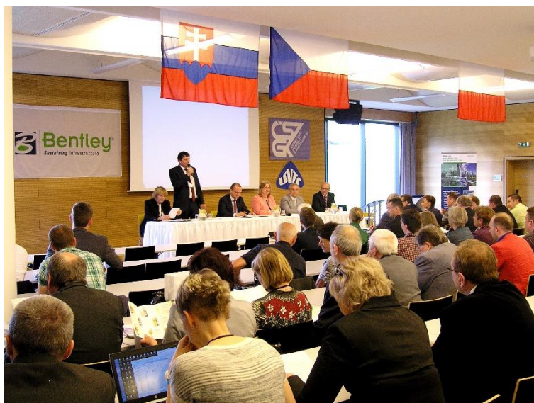
XXI Międzynarodowe Polsko-Czesko-Słowackie Dni Geodezji