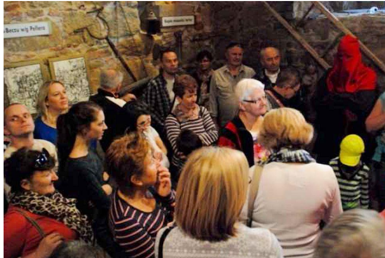
Zwiedzanie starego miasta Biecza i średniowiecznych lochów