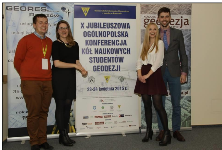
Uczestnicy X Jubileuszowej Ogólnopolskiej Konferencji Kół Naukowych Studentów Geodezji