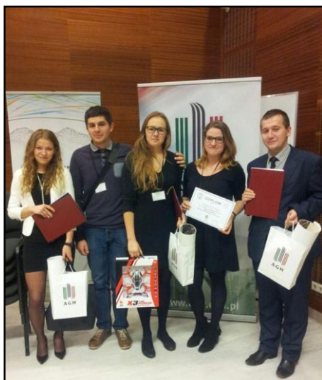
Uczestnicy I Forum GPS

W roku 2015 odbyły się trzy wycieczki szkoleniowo – turystyczne: