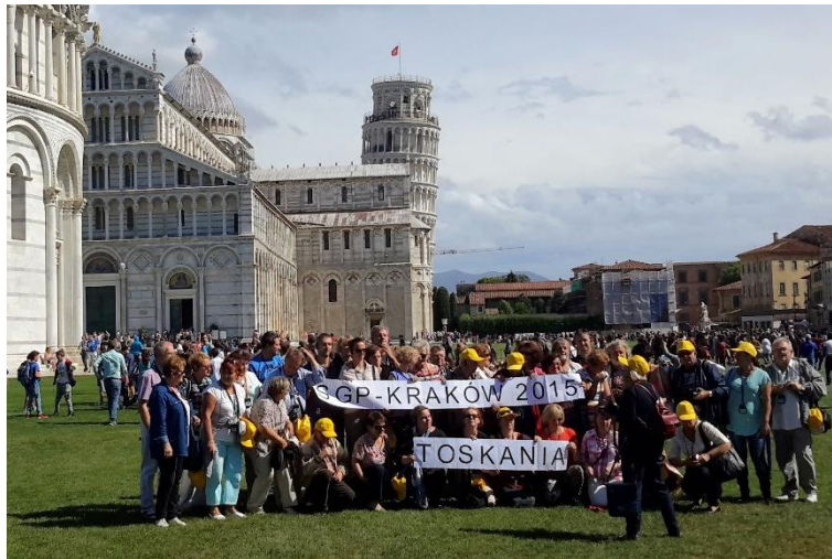
Uczestnicy 27 wypraw przy Krzywej Wieży w Pizie