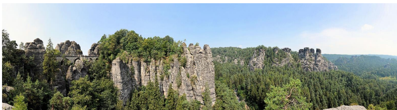
Skalny most - Szwajcaria Saksońska.