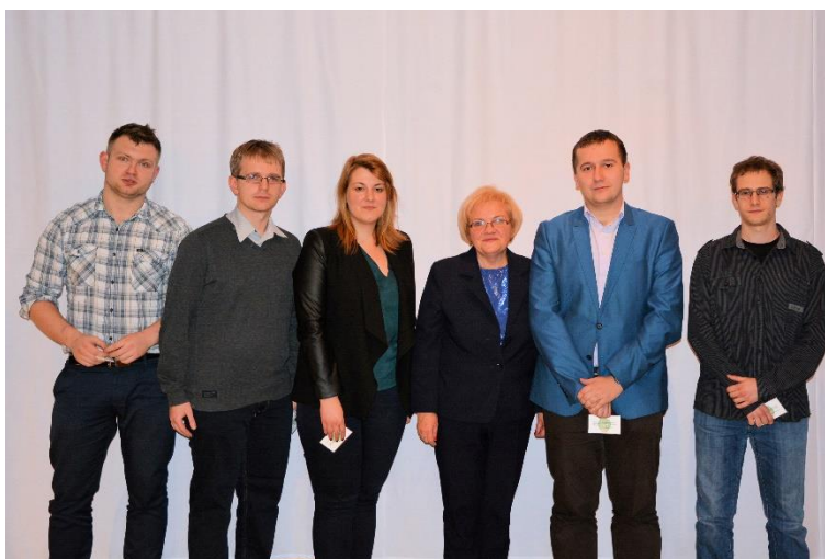
Nowi członkowie SGP Oddział Kraków.