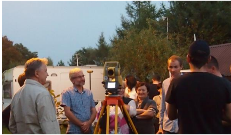
Pokaz sprzętu geodezyjnego firmy TPI