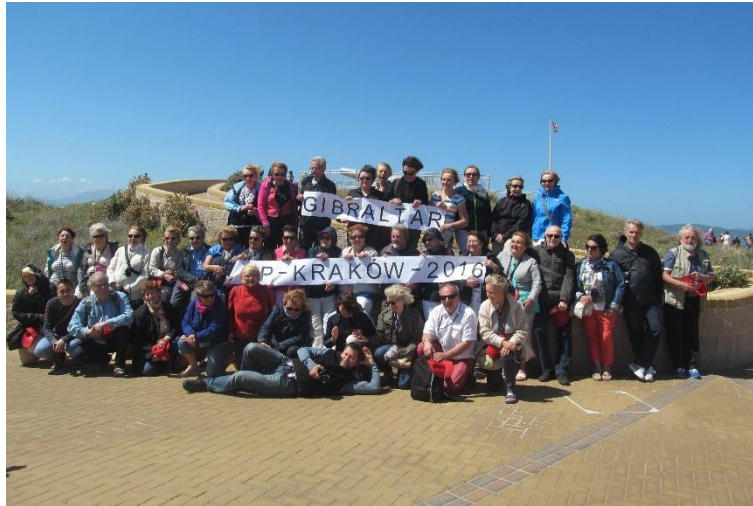
Uczestnicy 28 wyprawy na Gibraltarze