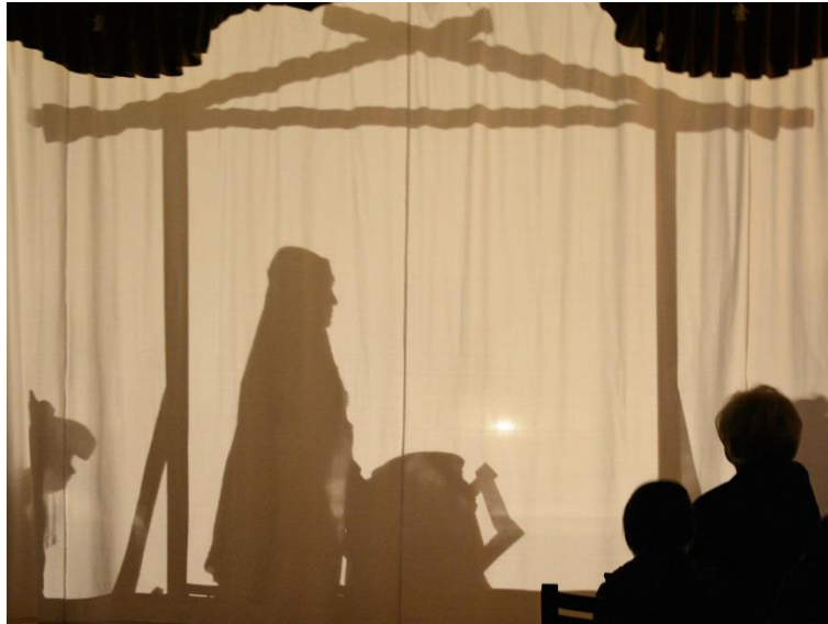
Jasełka w wykonaniu podopiecznych Domu św. Ludwika w Krakowie