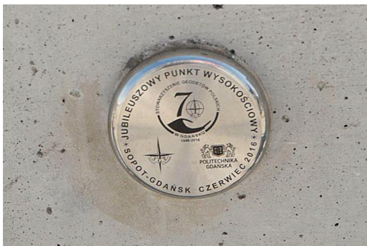
Jubileuszowy punkt wysokościowy.