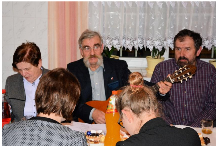
Wspólne kolędowanie SGP Oddział Kraków

W roku 2016 prowadziliśmy działalność stowarzyszeniową organizując szkolenia, kursy, wycieczki i inne imprezy o charakterze towarzysko-integracyjnym: