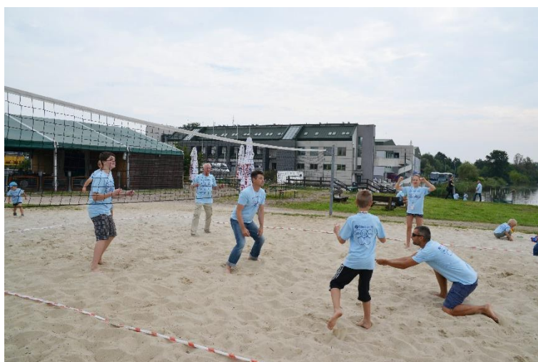
Dzień Geodety 2015, siatkówka plażowa.