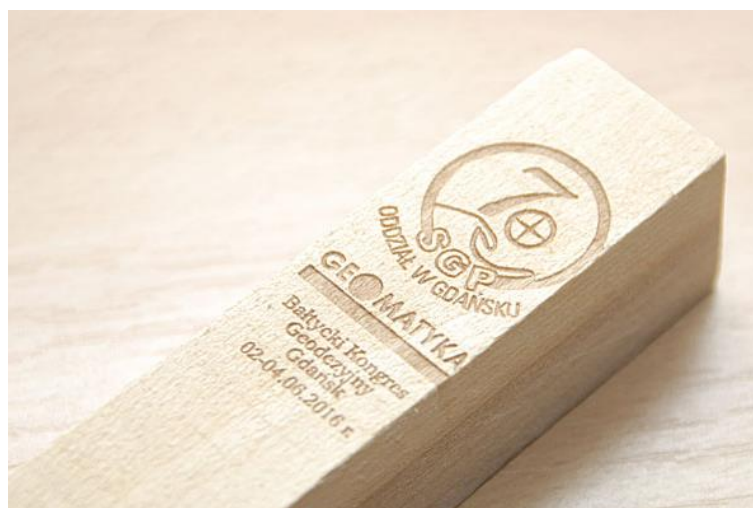
Pamiątkowy palik dla uczestników Jubileuszu oraz Kongresu.