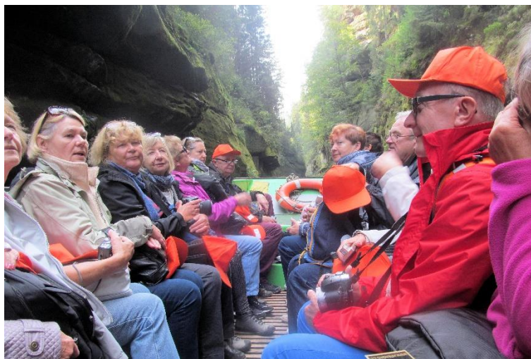
Uczestnicy 29 wypraw podczas spływu kajakowego przełomem Kamienicy – Szwajcaria Czeska.