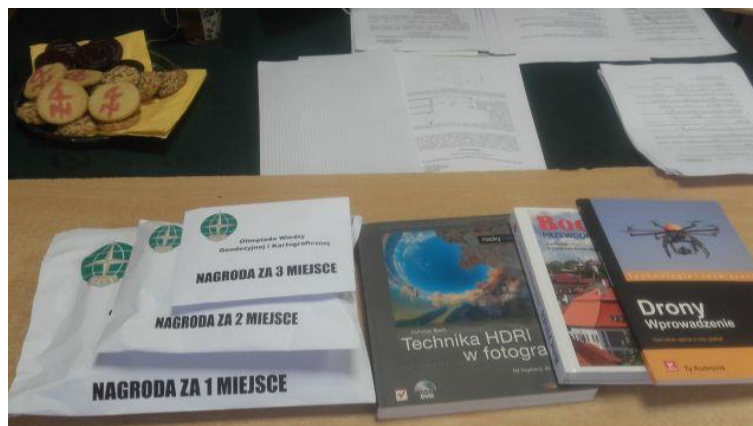
Nagrody ufundowane przez SGP oddział Kraków dla finalistów I edycji Olimpiady w małopolskich szkołach

Zarząd SGP Oddział Kraków dla laureatów w każdej szkole ufundował nagrody rzeczowe.