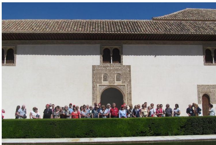
Uczestnicy 28 wyprawy SGP