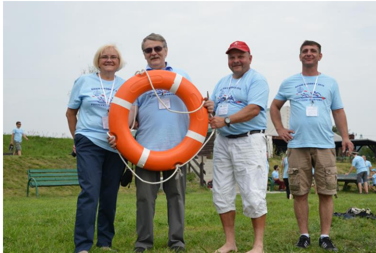
Dzień Geodety 2015, uczestnicy z kołem ratunkowym.