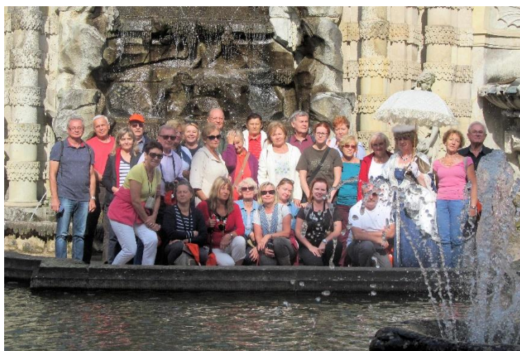
Uczestnicy 29 wypraw w Dreźnie wraz z przewodniczką.