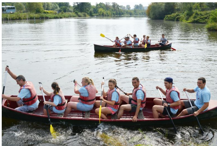
Dzień Geodety 2015, wyścigi smoczycz łodzi.