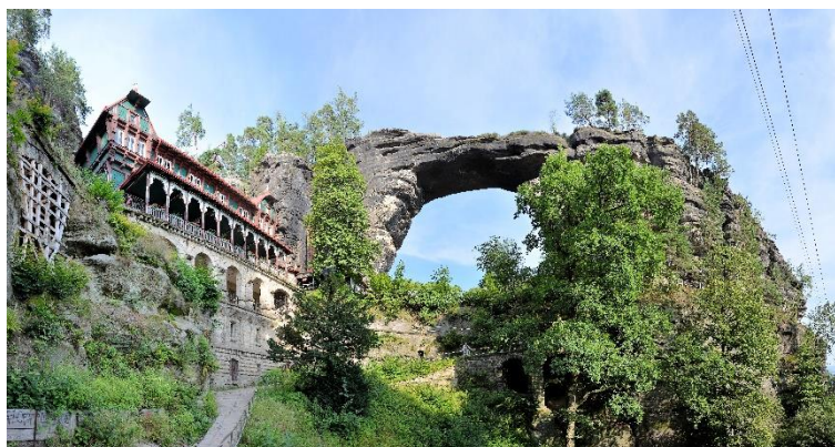
Brama Pravcicka Szwajcaria Czeska Sokole Gniazdo.