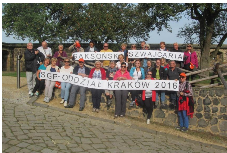
Uczestnicy 29 wypraw na zamku w Stolpen.