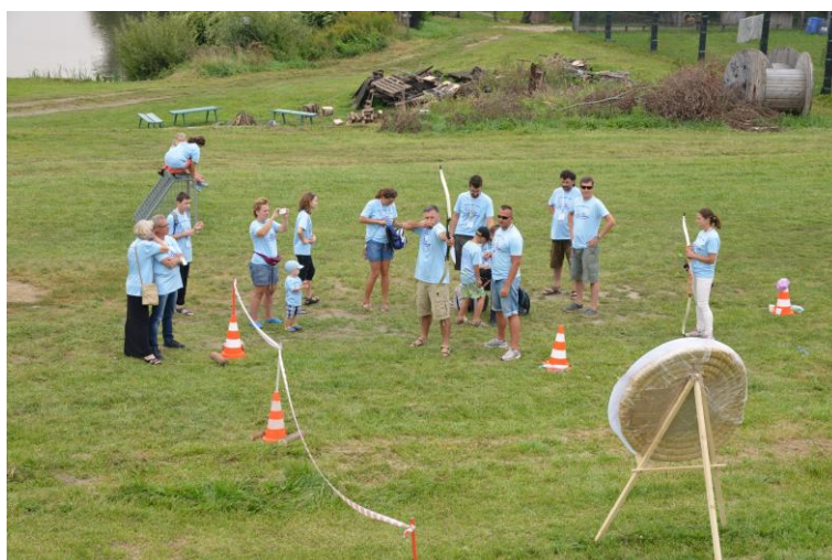
Dzień Geodety 2015, strzelanie z łuku.